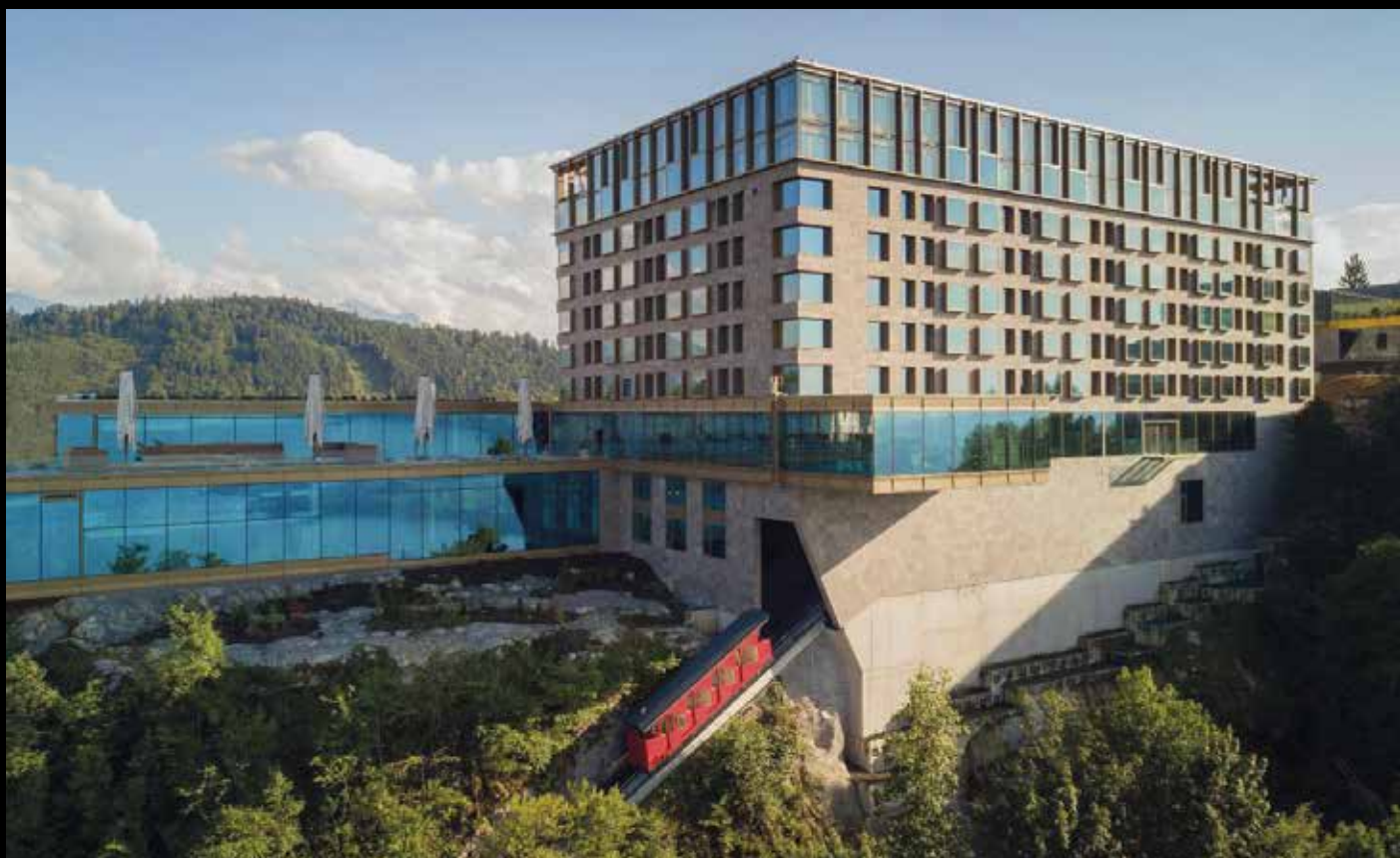
Sektion Mitte und Sektion Ost zur ersten gemeinsamen Fachtagung und GV auf dem Bürgenstock.