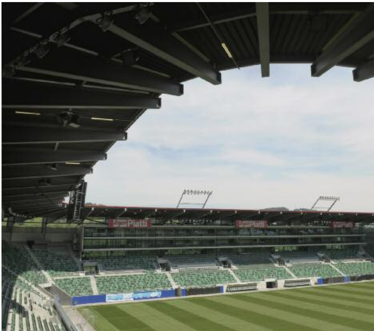
AFG-Arena St. Gallen

Società Svizzera Specialisti per la Pro- tezione antincendio e per la sicurezza www.vbsf.ch