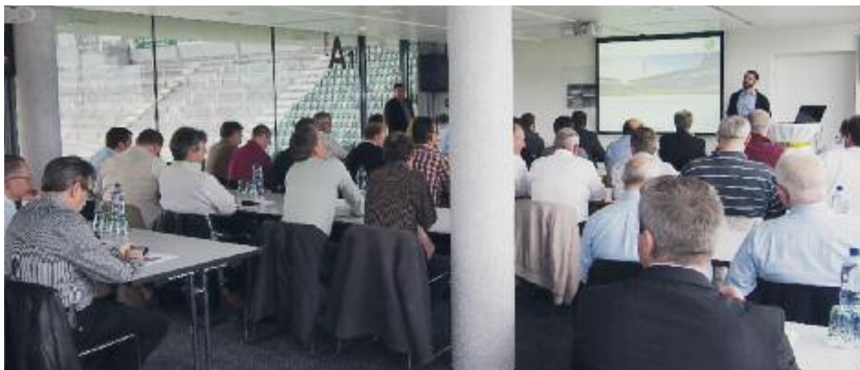
Seminarraum mit Blick Richtung Arena

Am Nachmittag wurden ebenso interessant die Facetten der Sicher-